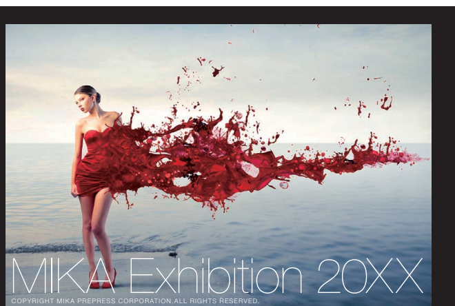
弊社技術スタッフによる調整後のイメージ