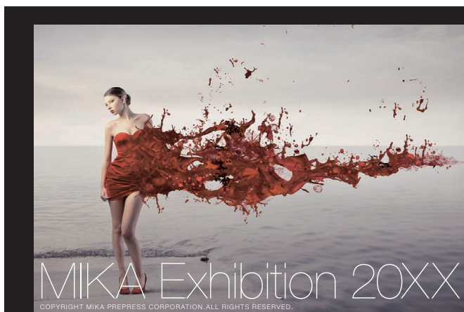
用紙とプロファイルが合っていない場合

ショナルによる製版技術で対応しております。プロによるデータの調整、プロ仕様のインクジェット出力機でハイクオリティなビジュアル再現を可能にします。