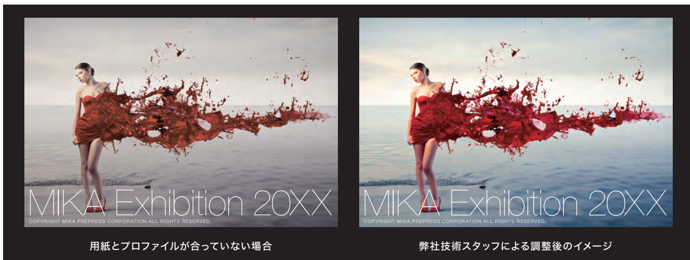
用紙とプロファイルが合っていない場合

ショナルによる製版技術で対応しております。プロによるデータの調整、プロ仕様のインクジェット出力機でハイクオリティなビジュアル再現を可能にします。