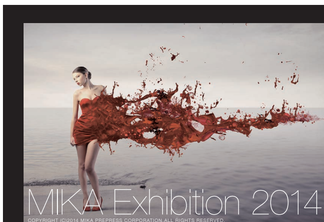
データ通りの出力

いるプロフェッショナルによる製版技術で対応しております。プロによるデータの調整、プロ仕様のインクジェット出力機でハイクオリティなビジュアル再現を可能にします。