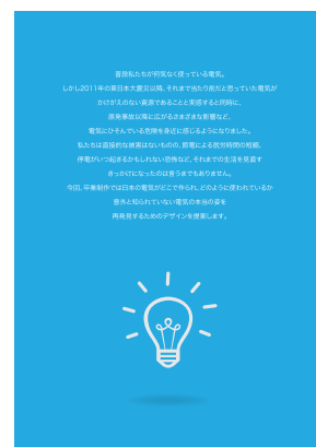
コンセプトボード