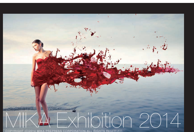
弊社技術スタッフによる調整後のイメージ