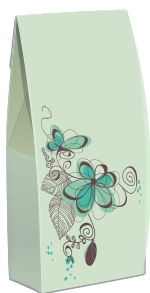
ブランディングのツール (ショッピングバッグ)など